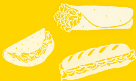
Sandwichs, Wraps & Fajitas