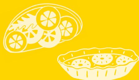
Tartes Salées & Tartines